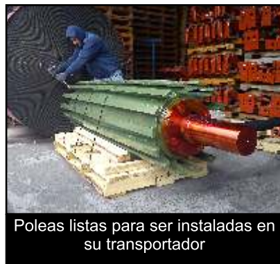
Poleas listas para ser instaladas en su transportador