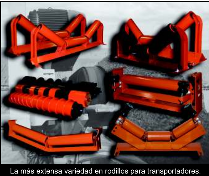
La más extensa variedad en rodillos para transportadores.