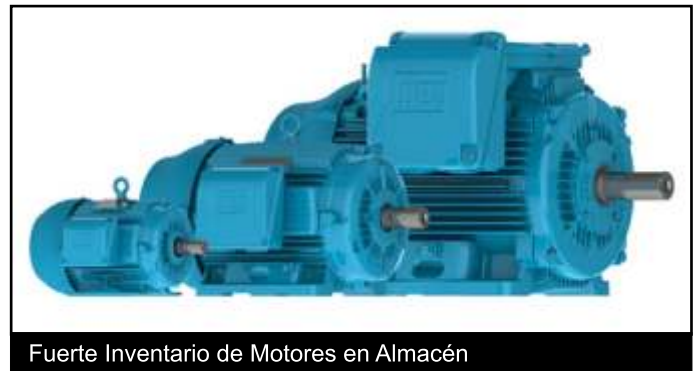
Fuerte Inventario de Motores en Almacén