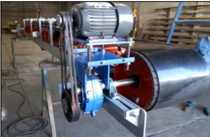
Cubrimos cualquier necesidad requerida