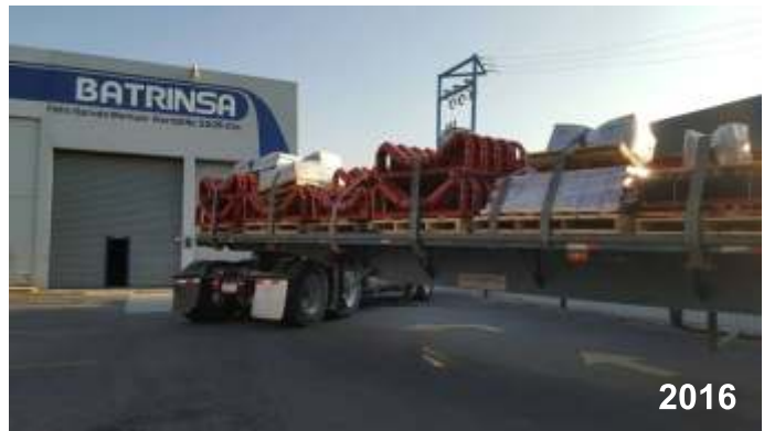
Recibiendo embarque a temprana hora por la mañana.