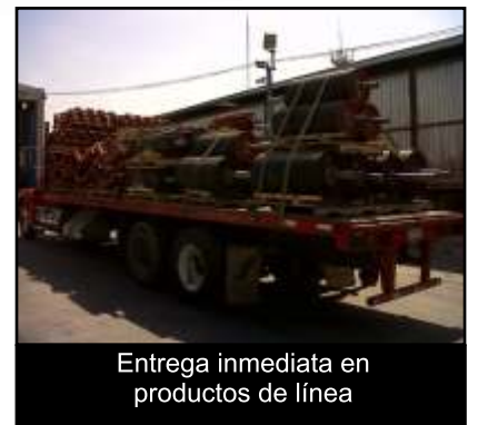
Entrega inmediata en productos de línea

“Recibir un embarque con poleas armadas listas para ser instaladas redujo considerablemente nuestro tiempo de maniobras y montaje”.