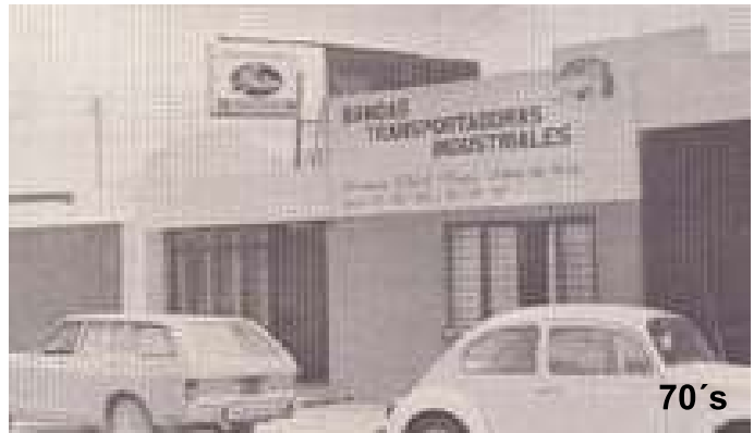
Vista parcial de la fachada de BATRINSA a finales de los 70's.