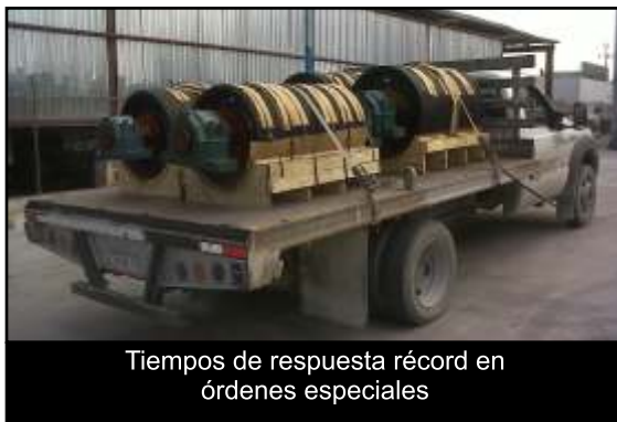
Tiempos de respuesta récord en órdenes especiales