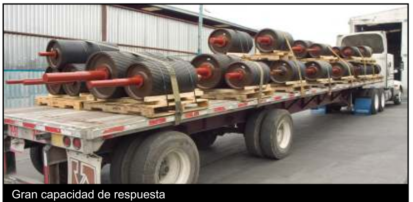
Gran capacidad de respuesta