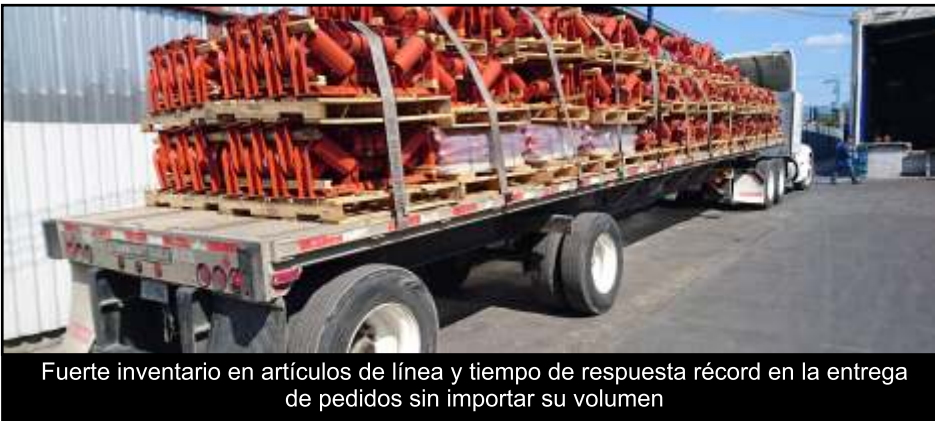
Fuerte inventario en artículos de línea y tiempo de respuesta récord en la entrega de pedidos sin importar su volumen

“Tenemos en nuestra planta rodillos de SUPERIOR que superan ya los 7 años trabajando.