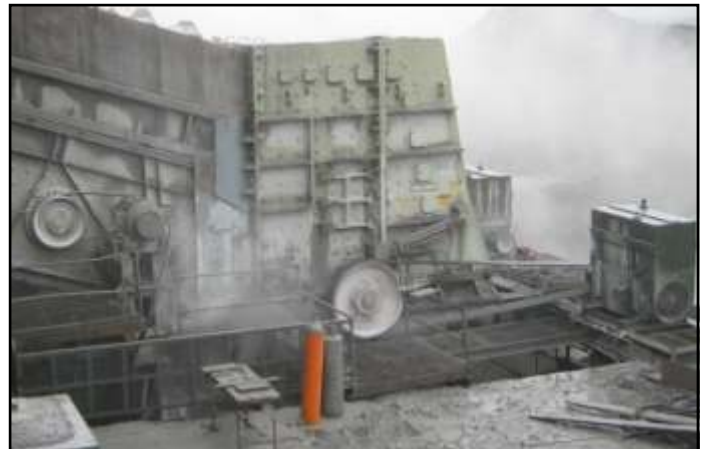
Gran capacidad de respuesta

BATRINSA mantiene una política de Satisfacción Completa del Cliente La capacitación continua y un proceso de mejora constante son parte importante para el logro de este objetivo.